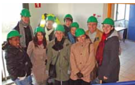
Sortie du groupe «lire, écrire, parler français» au centre de tri à Penol