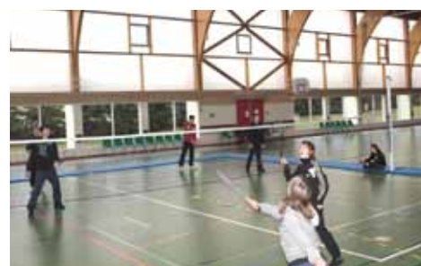
Tournoi de Badminton