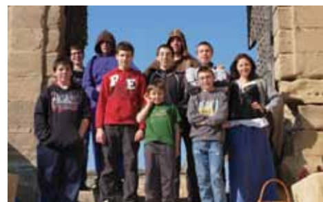
Sortie à Saint Antoine l'Abbaye

Et pour satisfaire les plus intrépides... une journée luge à la Ruchère ponctuée de glissades infernales et de chutes mémorables.