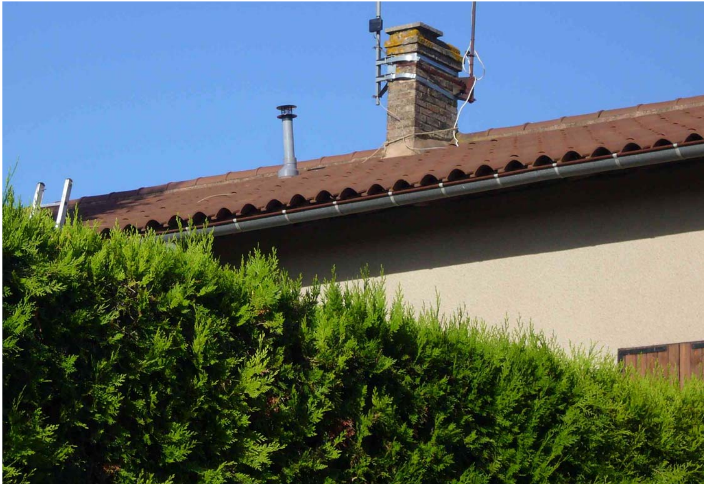
Extracteur statique dépassant de 40 cm le faîtage du toit