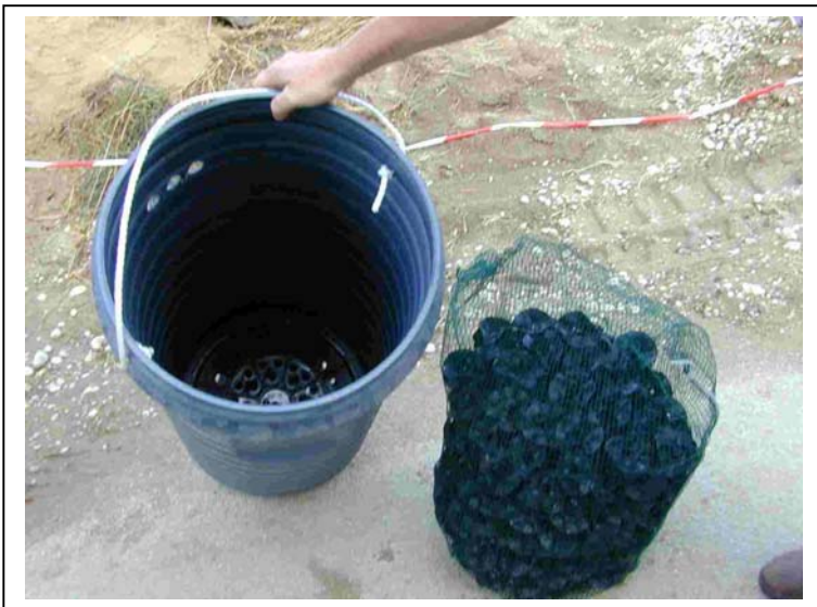
Préfiltre en « fleurs de plastique »