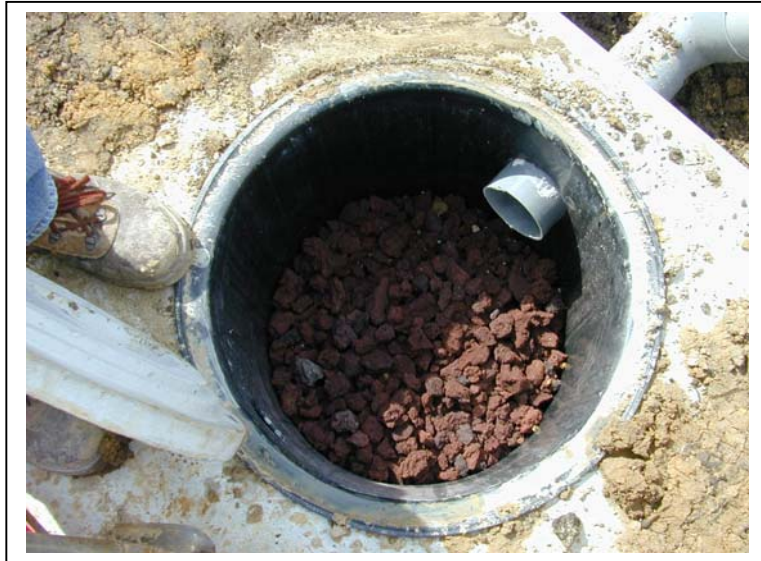
Préfiltre en pouzzolane