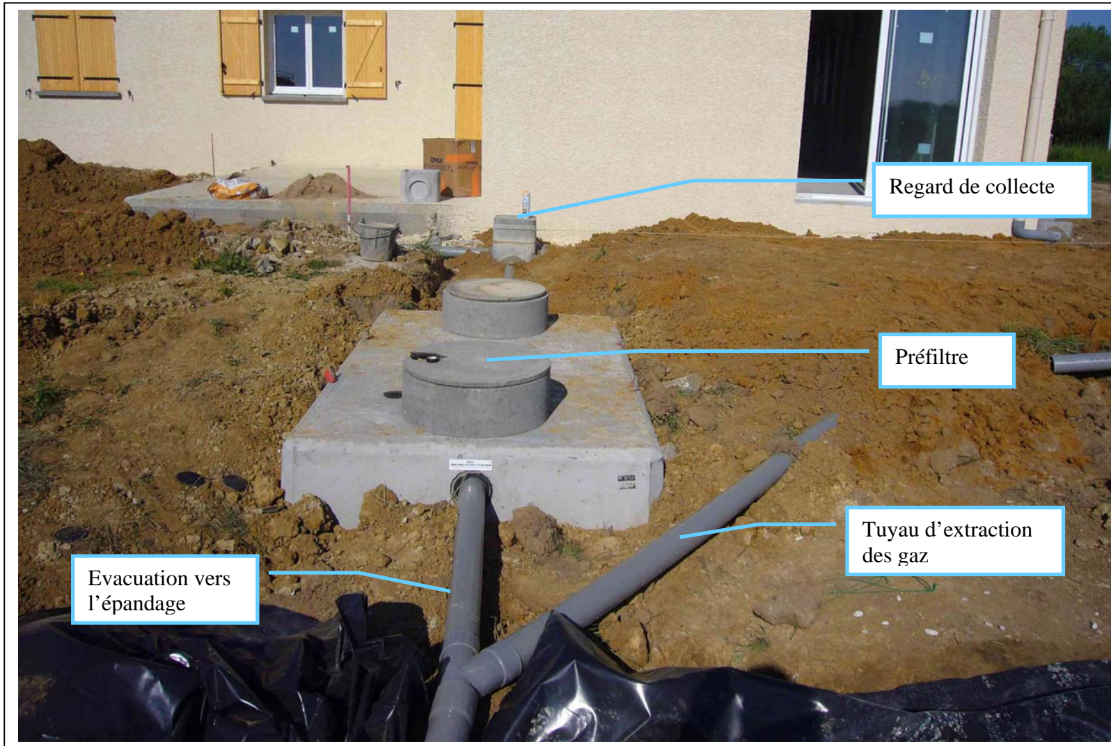
Fosse en béton avec préfiltre intégré